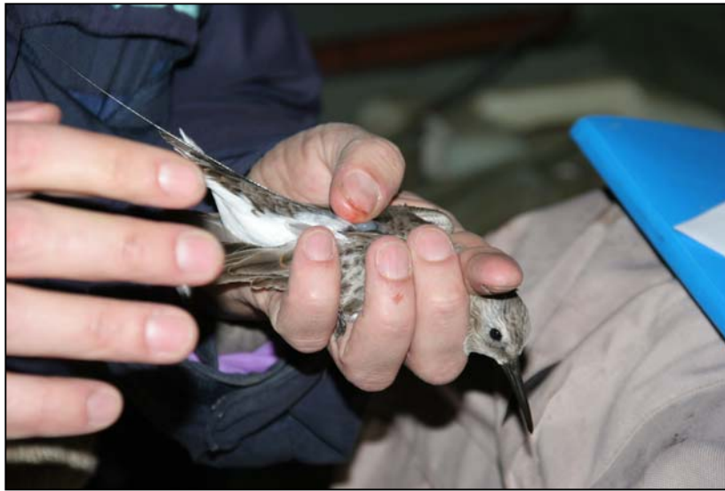
Figura 6. Movimenti di Piovanelli pancianera radiomarcati negli inverni 2006/2007 e 2007/2008.