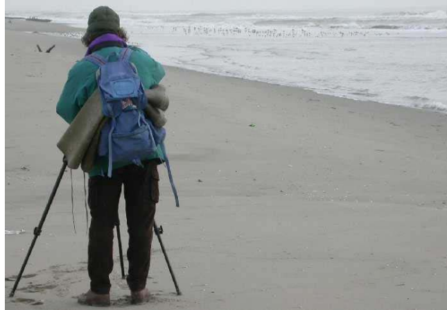
Figura 2. Anche le sterne (nell'immagine, dei beccapesci) mostrano un comportamento gregario influenzato dai movimenti di marea: in questi casi non è tuttavia l'area di foraggiamento a subire variazioni, ma è la disponibilità di aree appena emergenti, idonee al riposo notturno, che condiziona la formazione degli stormi. Il Bacàn di Sant'Erasmus ha in questo senso un'importanza unica nel contesto veneziano.